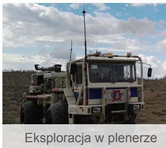
Eksploracja w plenerze

Klienci mogą wybierać spośród różnych modułów i akcesoriów spełniających wymagania różnych branż.